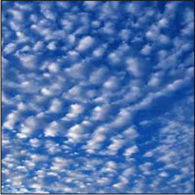
xaydhxaydh Altocumulus, Ac