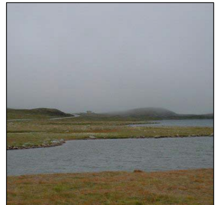
ceeryaan Stratus, St