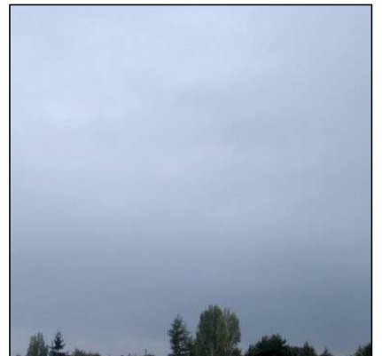
Caad Nimbostratus, Ns

NATURFAGSENTERET NASJONALT SENTER FOR NATURFAG I OPPLÆRINGEN