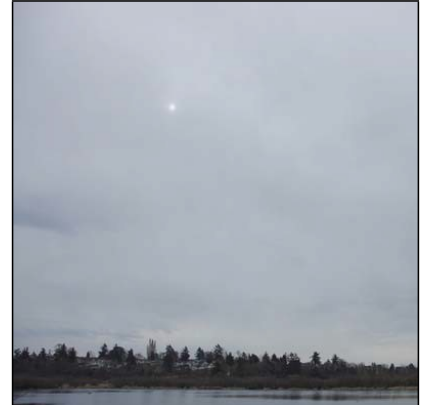
dhool Altostratus, As