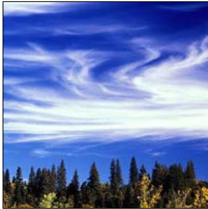
roobdoon Cirrus, Ci