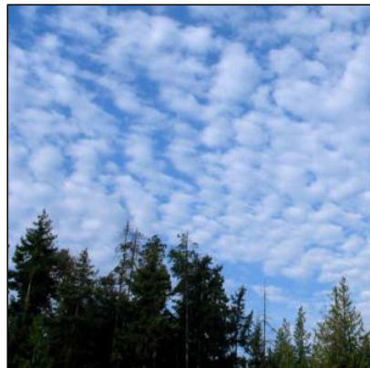
guulato Stratocumulus, Sc