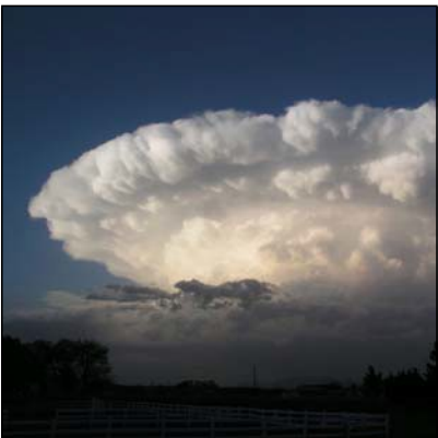
hogol Cumulonimbus, Cb