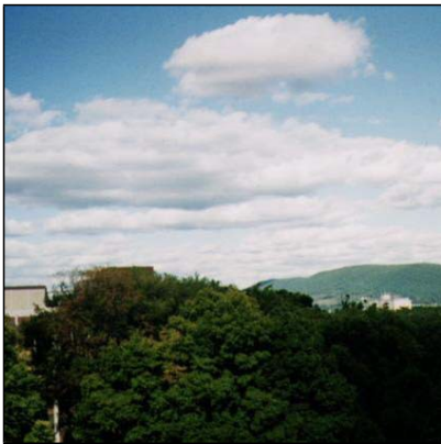
waqal Cumulus, Cu